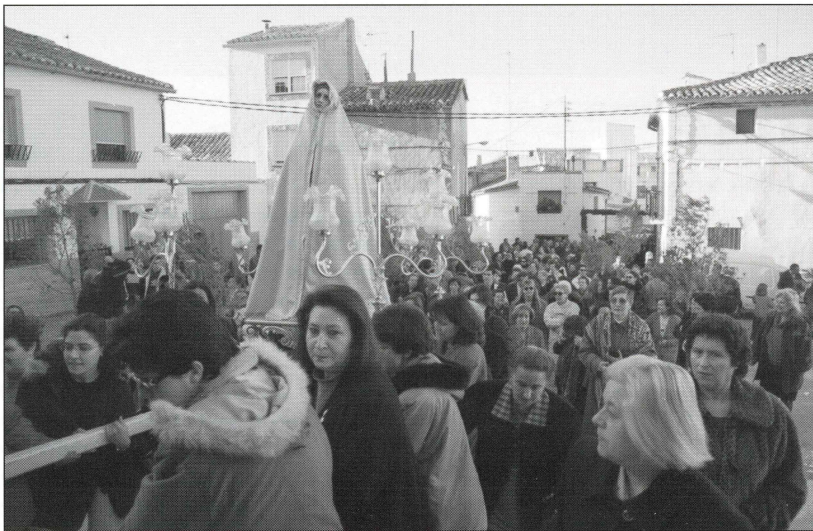
Procesión del Encuentro el Domingo de Resurrección.

El castigo, la destrucción o la quema de estos monigotes quedaba asociada simbólicamente